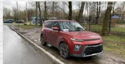
Брюсовская ул., 1, б. к. 3; пр. Науки, 77, к. 3; Сибирская ул. 16; Кушелевская дорога, 7 к.3.

Пискаревский пр., 48, к. 3, 50, 52; Мечникова пр., 3, к. 2, 14, 18; ул. Замшина, 70; ул. Бестужевская, 20, к. 2; Меншиковский пр., 1, 15, к. 1;