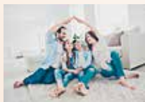
Отдел опеки и попечительства Понедельник с 10:00 до 12:00 Четверг с 15:00 до 17:00